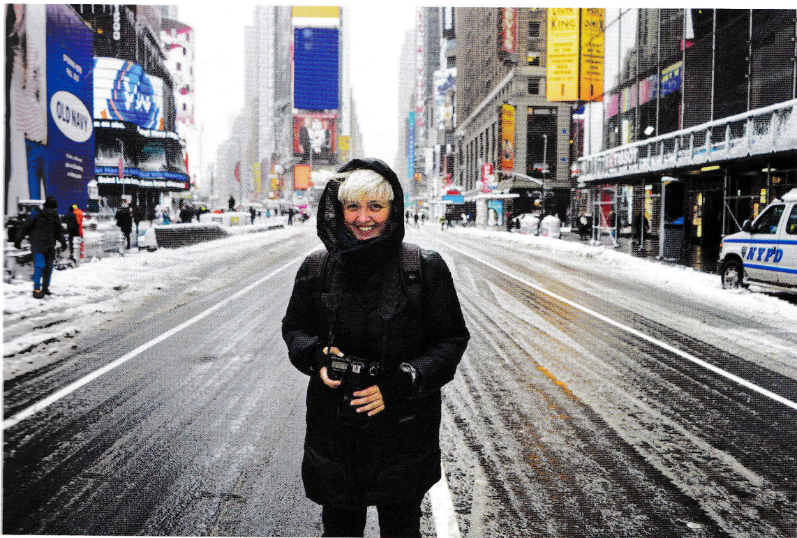
NEW YORK, SUA

Sper ca această carte să creeze legături noi între oameni. Haideti să începem călătoria!